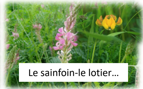
Le sainfoin-le lotier...