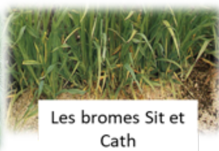
Les bromes Sit et Cath