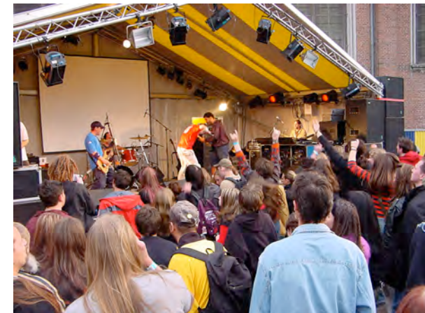
Liberchies, le 24 novembre 2005